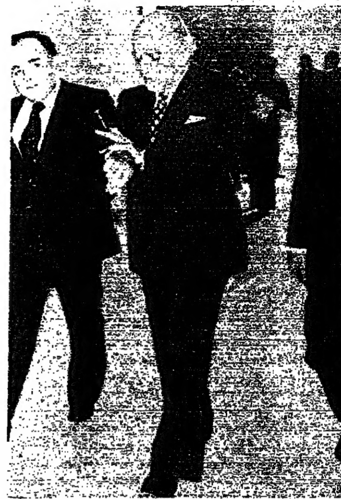
الرئيس سلام والعمير لوزة الجوري لدى مغابتهما قصر بعبدا امس